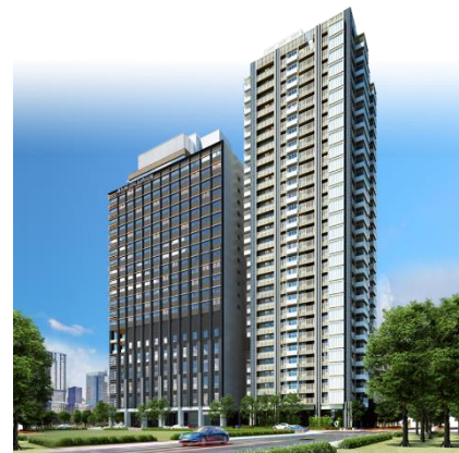
日航酒店 3 高雄市 預計2023年開幕