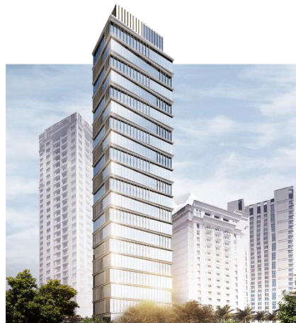
Capri by Fraser 2 馬來西亞吉隆坡 營運中