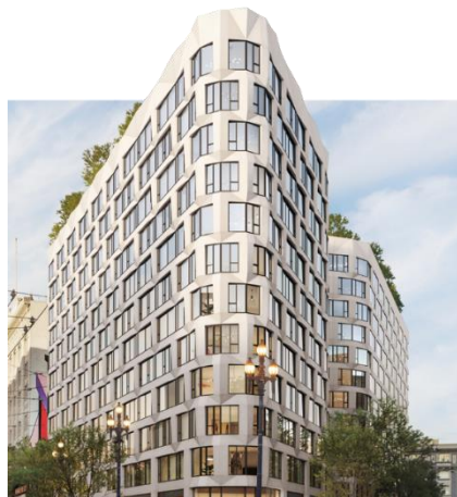
THE LINE飯店 2 美國舊金山 預計9月開幕