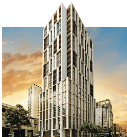
寒居酒店 1 台北市 營運中